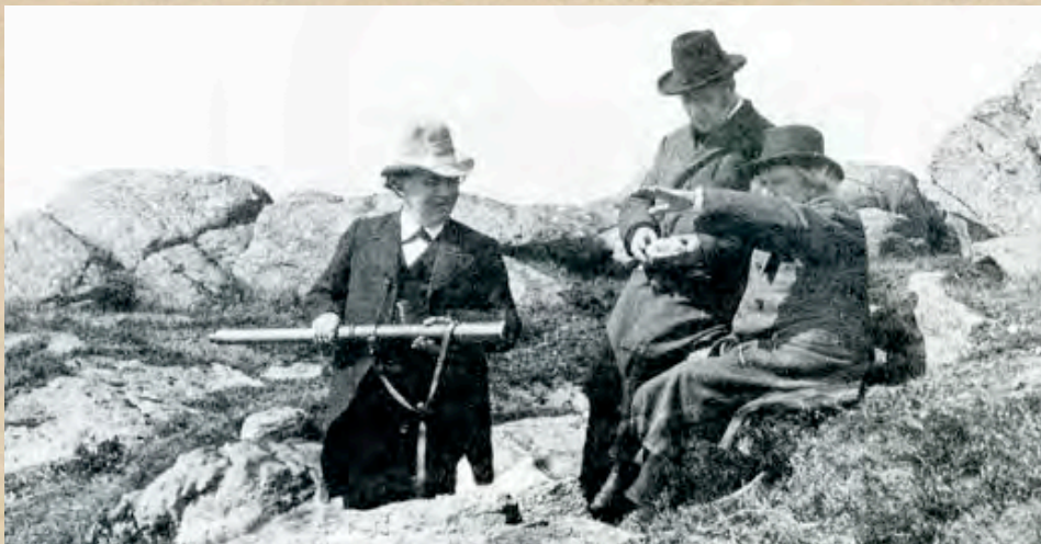
Julius Röntgen met Grieg (en een vriend) in Jotunheim (Noorwegen)

Edvard Grieg – Sehnsucht nach Julius (piano solo)